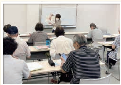
スマートフォン活用講習