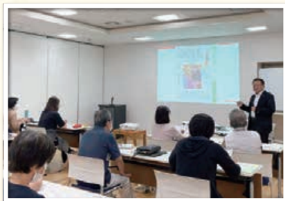
リージョナルサポート(学童保育)講習